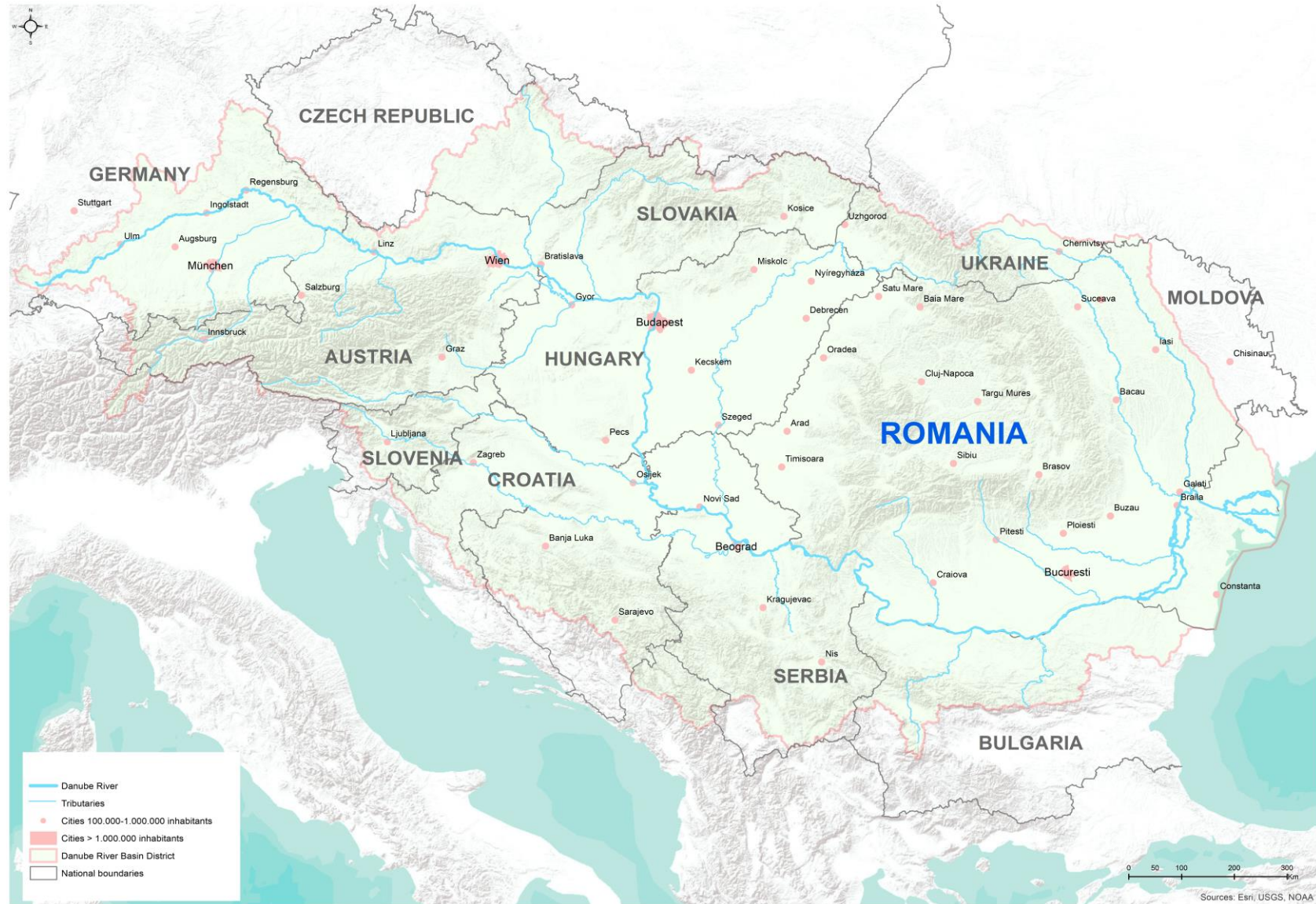
Figura 1.2. Districtul Hidrografic al Fluviului Dunăre